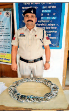
वर्ग का चेकिंग अभियान चलाया गया, जिसमें युवाओं द्वारा अपने हाथों में लोहे का चूड़ा एवं कड़ा पहना पाया गया। किसी भी वाद विवाद तथा लड़ाई झगड़े की स्थिति में उक्त चूड़े का उपयोग एक घातक हथियार के रूप में किया जा सकता था, जिसे दृष्टिगत रखते हुए पुलिस बल द्वारा लगातार चेकिंग करते हुए युवाओं के हाथों में पहने लोहे के चूड़ा एवं कड़ा को निकलवाना प्रारंभ किया और देखते ही देखते पुलिस टीम द्वारा चेकिंग कार्यावाही कर 102 धारदार लोहे का कड़ा एवं चूड़ा जब्त किया। जब लोहे के चूड़े में धार लगी थी, जो एक अत्यंत धारदार घातक हथियार के रूप में प्रतीत हो रहा था।

नगर में बुधवार की शाम उर्स रैली का आयोजन किया गया। इस दौरान उर्स रैली नगर के प्रमुख चौक चौराहों से होते हुए नगर का भ्रमण का कार्यक्रम था, जिसमें श्रद्धालुओं की भारी भीड़ थी। इस भीड़ में युवा वर्ग भी काफी संख्या में शामिल हुए थे। कार्यक्रम के दौरान समुचित शांति व्यवस्था हेतु सिमगा पुलिस द्वारा पर्याप्त सुरक्षा प्रबंध किया गया था। इस दौरान पुलिस बल द्वारा उर्स रैली कार्यक्रम में शामिल तथा रैली के आसपास उपस्थित विशेषकर युवा